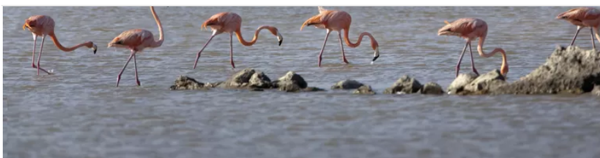
Bonaire Eiland, Nederlandse Antillen, Flamingo met op de achtergrond zoutmijnen.

Het zuiden van het eiland Bonaire kan onder water komen te staan, en inwoners lopen steeds meer gevaar door orkanen. Maar de Nederlandse overheid doet veel te weinig om deze gevolgen in kaart te brengen, concluderen onderzoekers.